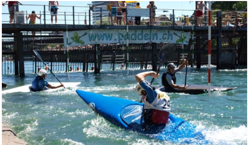
Impression vom Nachwuchscup 2011.

Ehrlich gesagt: Ob die im Titel gemachte Aussage zutrifft, wissen wir nicht so genau. Jedenfalls findet an diesem Datum der Nachwuchscup Zürich statt. Wie immer werden Helfer gesucht.