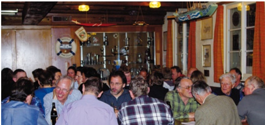
Für die GV war der WVZ beim Limmat-Club zu Gast.

Die Generalversammlung vom 6. März 2009 verlief ruhig und unauffällig. Der Vorstand wurde unverändert in seinen Ämtern bestätigt, dafür gab es neue Revisoren. Die finanzielle Lage des Vereins ist solid.