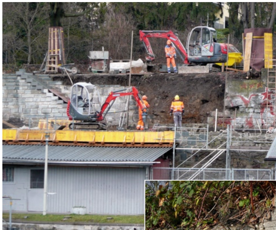
Die Treppe West (Bilder oben) wurde mit Sandsteinplatten wieder hergerichtet.