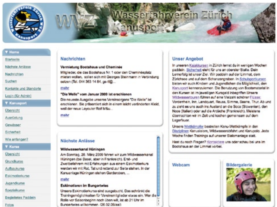
Ein regelmässiger Blick auf www.paddeln.ch lohnt sich.

An den statischen Seiten hat sich wenig geändert, doch bei den dynamischen Seiten gibt es viel Neues. So wurde die Kursadministration fast vollständig in die Website integriert. Damit lässt sich das Mehrfacherfassen von Daten vermeiden, und der ganze Arbeitsablauf inklusive Versand von Bestätigungs-E-Mails usw. verläuft stark automatisiert (aber