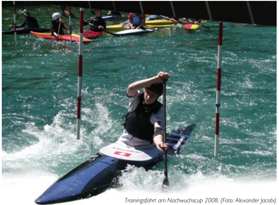
Trainingsfahrt am Nachwuchscup 2008.