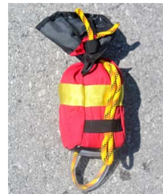
Bereit für den Einsatz. Das Seilstück ausserhalb des Sacks erspart die Suche nach dem Seilanfang.

Zum Befüllen des Wurf-sacks hält man den Sack mit der einen Hand leicht angewinkelt vor sich und lässt das Seil über die Schulter laufen. Mit der anderen Hand stopft man das Seil in den Sack. Es legt sich innen dann von selbst in die richtigen Schlingen.