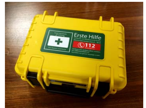
Der WVZ hat drei neue Notfallapotheken.

aaj. – Der WVZ verfügt über drei neue Notfallapotheken, verpackt in einer wasserdichten Box, sodass sie auch aufs Wasser mitgenommen werden können. Zwei sind im Letten im Bootshaus 2 stationiert, eine im Bootshaus Schanzengraben. Die Apotheken ersetzen die bisherigen alten und teilweise uralten Modelle. Andrea Etzensperger kümmert sich um den Unterhalt der Apotheken.