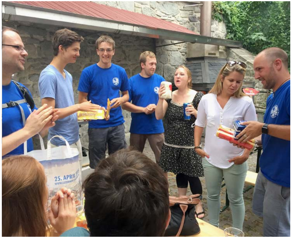
Am Span-Paddel-Fest im Letten trafen sich rund 35 WVZ-Mitglieder.

Am 26. Juli 2015 gabs im Letten ein Bootshausfest mit Spanferkel. Gute Spiele, gute Unterhaltung, gutes Essen, gute Laune – ein wunderbarer Tag!