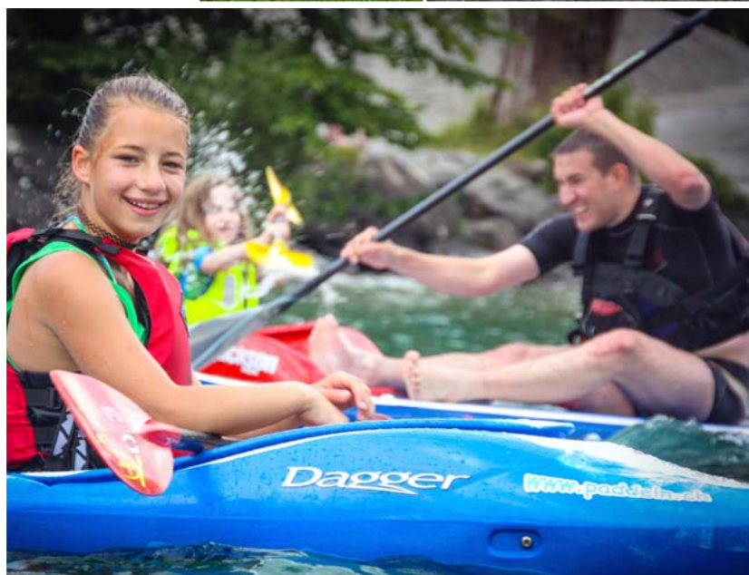
Am Wochenende für Familien in Brunnen herrschte hervorragendes Wetter und eine gute Stimmung.