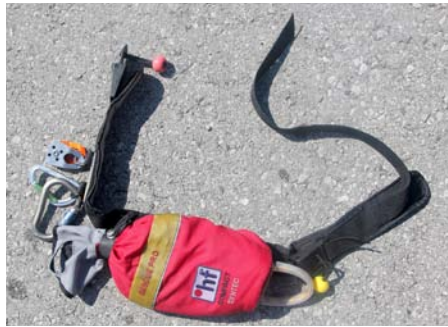
Wurfsack mit Tragegurt, inkl. Halterung für Karabiner.

Besser wäre es aber, den Wurfsack am Körper zu tragen. So hat man ihn immer dabei – auch wenn das Boot verloren gegangen ist. Auch hat man die Hände frei, um zu klettern und zu hantieren. Den Wurfsack kann man mithilfe eines Gurts um die Hüfte tragen. Viele Wurf-sackhersteller bieten passende Gurte an. Getragen wird der Wurf-sack am Rücken, was bei Kajakfahren allerdings zwischen Spritzdecke und Schwimmweste manchmal eng werden kann. Alternativ kann man ihn auch vorn unter der Spritzdecke tragen. Hier bleibt er trockener und ist somit leichter. Auf jeden Fall muss der Wurf-sack richtig geschlossen sein. Ein sich selbstständig machendes Seil ist eine ernsthafte Gefahr, sei es im Boot oder im Wasser.